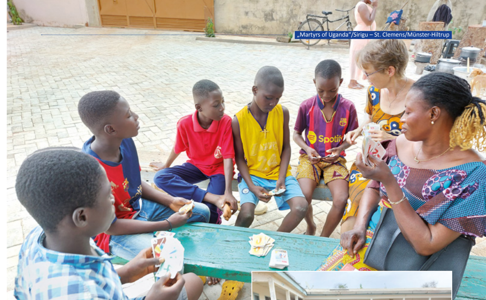
Kartenspielen mit den Kindern in der Nachmittagsbetreuung

Schulbesuche und Schulwettbewerbe rundeten dieses Programm ab.