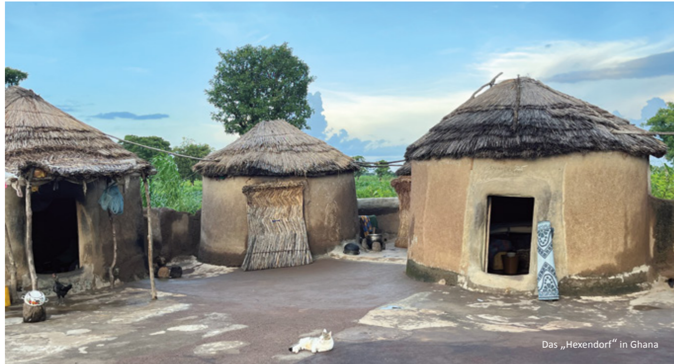
Das „Hexendorf“ in Ghana