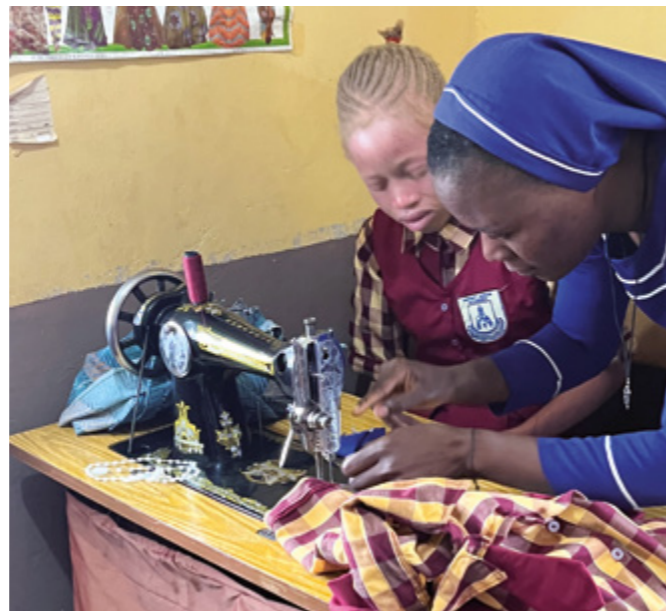
Im Konvent der Schwestern nahe des Dorfes Gushegu leben auch Kinder mit Albinismus, die von der Gesellschaft in Ghana nicht akzeptiert werden