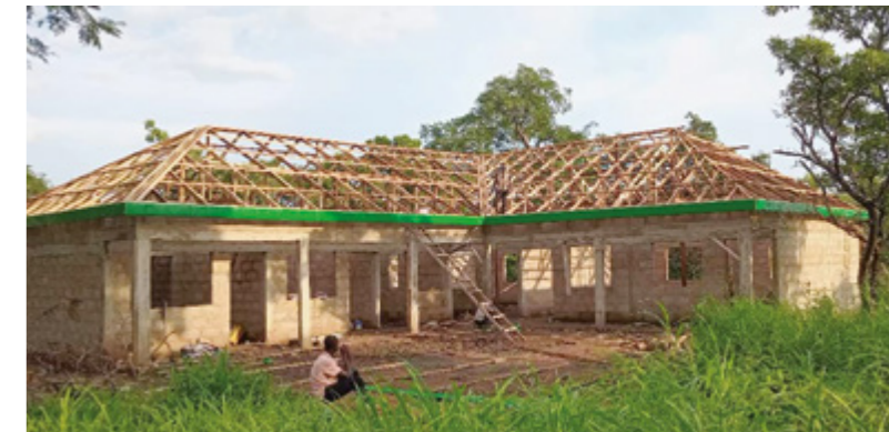
Im September waren die Mauern des Kindergartens schon hochgezogen und das Dach aufgerichtet

Die Partnerschaft lebt von Begegnung, Vertrauen und gemeinsamen Zielen. Für die Verantwortlichen ist deshalb die Pflege der persönlichen Kontakt mit den Mitgliedern der Partnergemeinde durch Besuche in Ghana sehr wichtig.