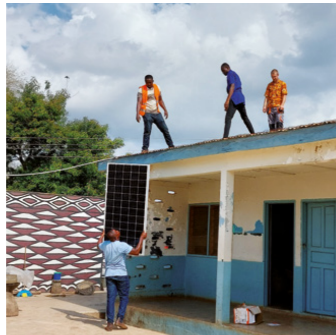
Montage der Solarpaneele auf dem Dach