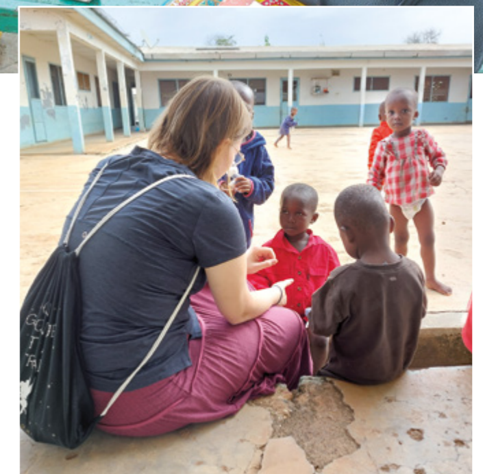
Auch die Kinder im Kinderheim freuten sich über den Besuch

Darüber hinaus besuchten die Hiltruper die bereits bestehenden Projekte. In der Gesundheitsstation war das Ultraschallgerät, welches im Januar nach Sirigu gebracht worden war, im Einsatz. Innerhalb kurzer Zeit hatte sich im Health Center viel getan. Die Aktenberge in den Gängen waren verschwunden, dafür war ein kleiner Raum entstanden, in dem Akutpatienten ihre Privatsphäre haben. Auch ein neuer Gebäudetrakt entsteht hier. Ein großer Segen für die Gemeinde Sirigu wäre außerdem ein kleiner Operationsraum.