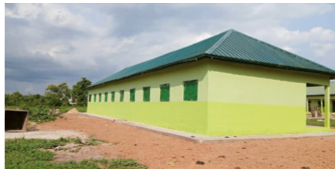
Die renovierte und erweiterte Junior High School