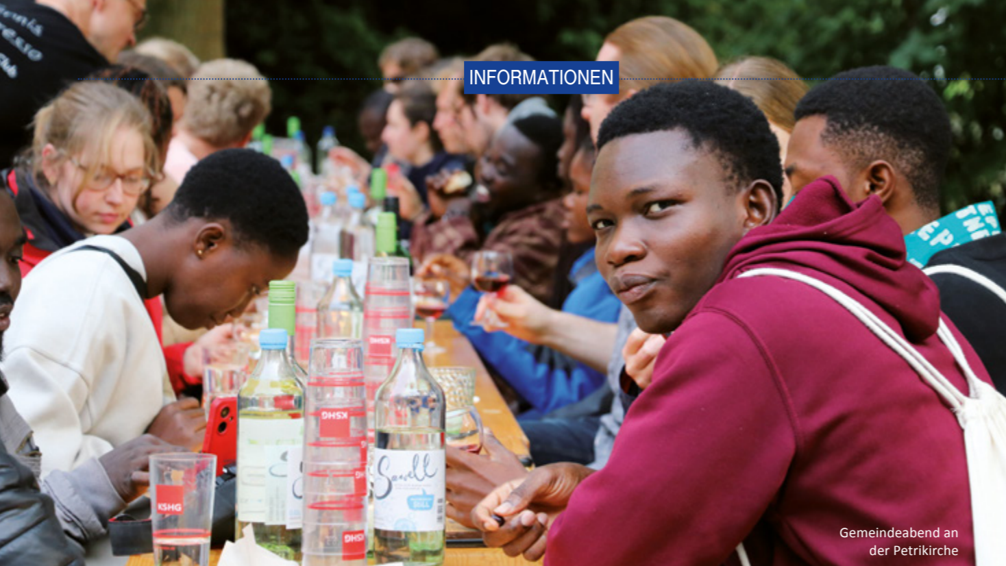
Gemeindeabend an der Petrikirche