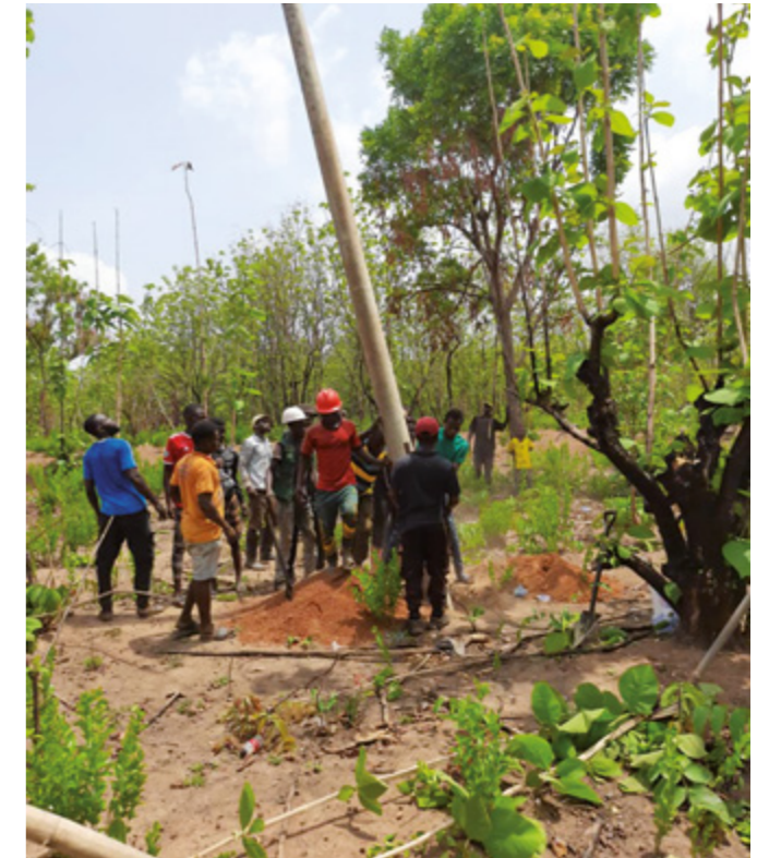
Das Bohren des Brunnens

Situation beigetragen (siehe Partnerschaft aktuell Herbst 2022, Seite 9).