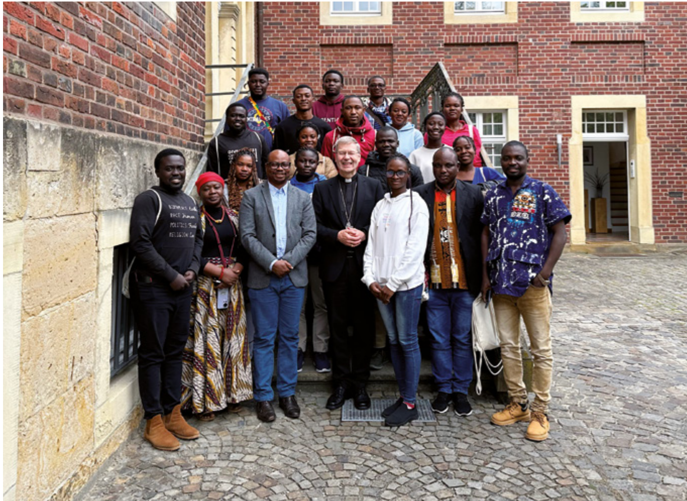
Gruppenfoto der ghanaischen Studierenden in Münster mit Weihbischof Stefan Zekorn