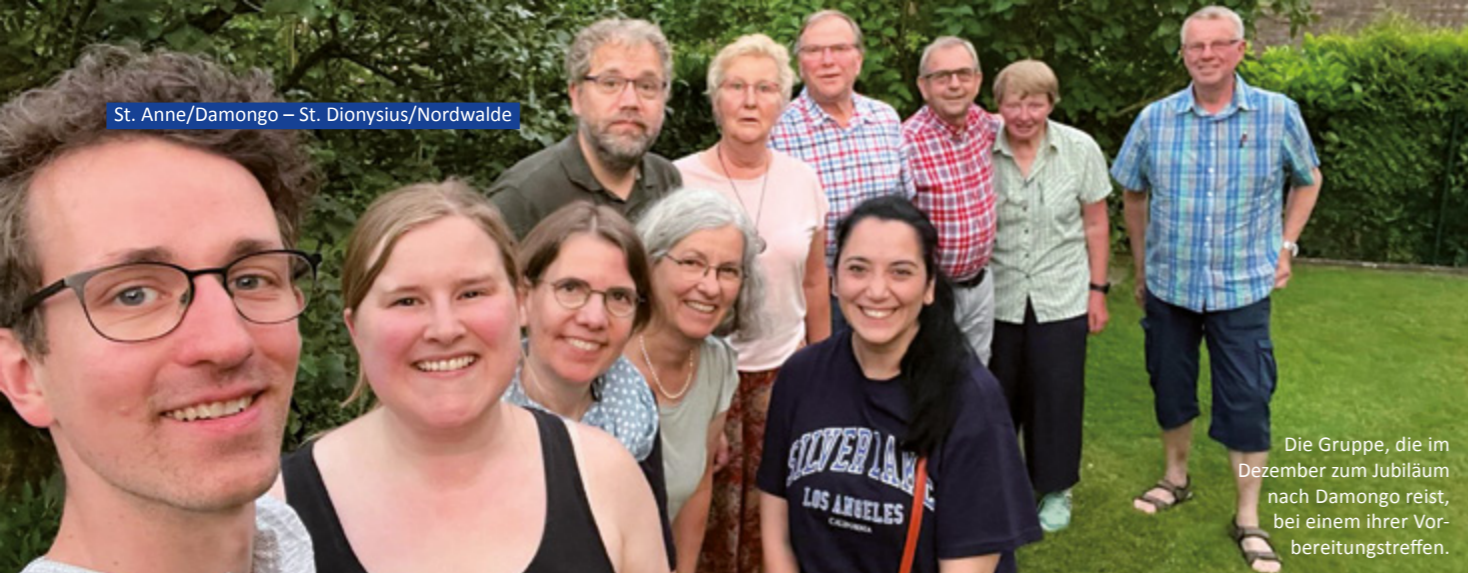
Die Gruppe, die im Dezember zum Jubiläum nach Damongo reist, bei einem ihrer Vorbereitungstreffen.